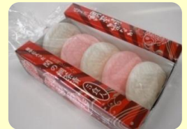
「佐賀関鯛茶漬藻なか」