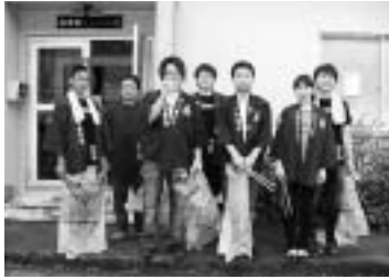
商工会館周辺の清掃▶ （湯布院町）