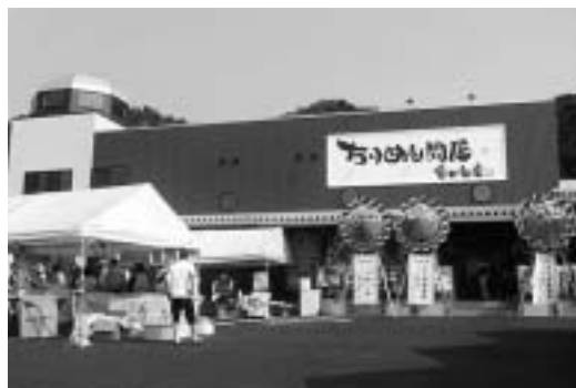
オープンしたちりめん問屋（外観）