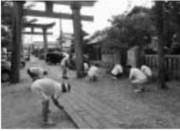
▲商売の神様（神明神社） 周辺の清掃（日出町）

今回の取組みは、青年部組織における一体感及び帰属意識を高める意義ある活動となりました。