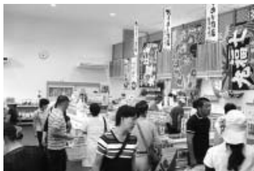
ちりめん問屋（店内）