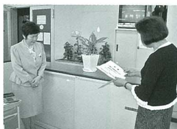
▲目録を贈呈する秦会長(右) (左) 宮崎県女性連 宮崎会長

*先日、女性部の皆様にご協力いただきました、宮崎県の口蹄疫に対する義援金を、6月17日、宮崎県商工会女性部連合会へ贈呈いたしました。宮崎県女性連合会の宮崎会長は、「皆様の善意に心より感謝申し上げ、有効利用させていただきます。」と涙ながらに、おっしゃられました。