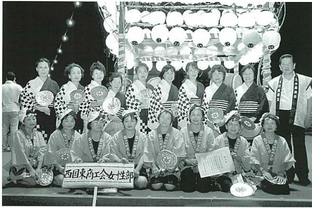
今年も真玉と香々地の女性部で、一致団結して優勝目指します!!!

西国東商工会女性部は市内30団体が参加する高田観光盆踊り大会に、昨年から2回連続参加しています。最初の参加では特別賞をいただき、昨年は優勝するという快挙を成し遂げました。多くの団体が一番を目指している大会で優勝できたことは大きな驚きとともに最高の喜びでした。今年もこの盆踊り大会に向けて部員一同結束して練習しています。次回の8月の大会では、昨年優勝者ということで会場のやぐらの上で踊りを披露します。たくさんのお客の前で踊るのはとても緊張しますが、新調した浴衣をまとって華麗(笑)に踊りたいと思います。