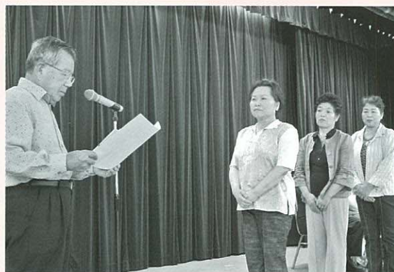
団体優勝の県央地区女性部