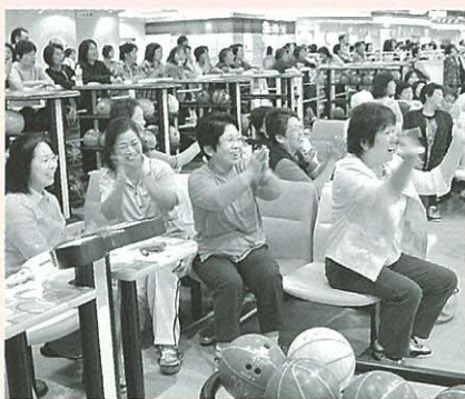
ストライクに沸く選手の皆さん