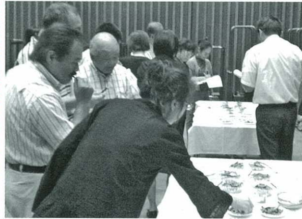
楽しく厳しく...求評会

その一環として、9月8日、「アストくにさき」で、専門家や一般消費者等約20名を招き、試作品として開発した漬物（三種類）とかりんとう・クッキーの5品について、味・見かけ・食感の3点を中心に求評をして頂きました。評価は様々で、かなり厳しいものもありました。