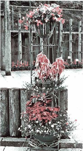
平成21年6月23日植栽 (木立ペゴニア・コリウス・ポーチュラカ)

私達は、平成十九年度に地域活力増進事業として、「住民と花いっばい運動」による景観づくりを実施し、継続して本年度も活動に取り組んでおります。天瀬町のキャッチフレーズでもある「花と温泉と祈りの町」にふさわしい景観をつくるために、自