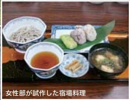
女性部が試作した宿場料理