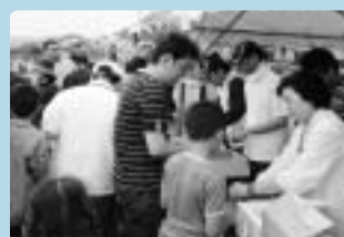
海産物が当たる抽選会

商工会青年部連合会は、青年部員の融和と団結を図るため、5月24日(日)豊後高田市香々地の西浜海岸で親善大会(県北ブロック幹事)を開催しました。本年度の大会内容「建て干し網漁」は、満潮時、沖に網を張り潮が引くのを待って網内に入った魚を捕る昔ながらの漁法で、浅瀬になった海中に入って直接魚を捕まるものです。当日は青年部員とその家族179人の参加があり、少し肌寒い天候でしたが、腰や肩まで海に浸かり漁体験を楽しむとともに地域の枠を超えた部員間の交流に一役買うことができました。