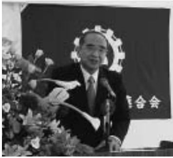
挨拶をする広瀬知事

開会にあたり、清家県連会長は「昨年来懸念されていた商工会と商工会議所の一元化の問題は、会員皆様のご協力により、地方分権改革推進委員会で、『新たな商工団体制度を設けるのではなく、商工会と商工会議所の特性を踏まえそれぞれの機能強化が必要』との結論を得た。同時に