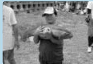
大物をゲットしたよ