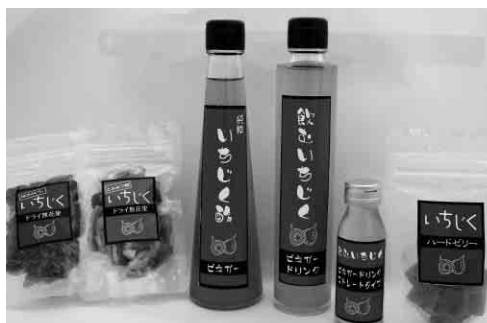
農商工連携商品一覧