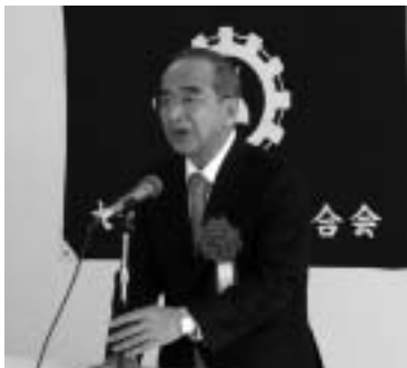
挨拶をする広瀬知事