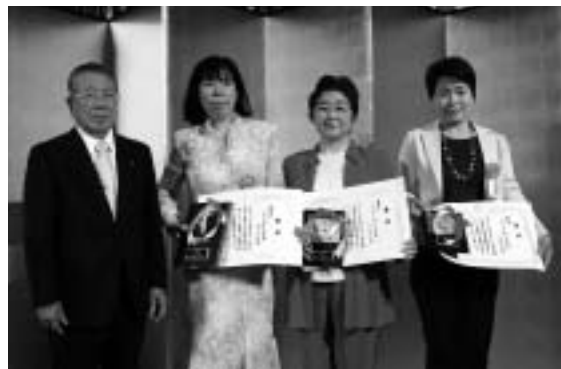
左から、清家会長、西田さん、井さん、後藤さん