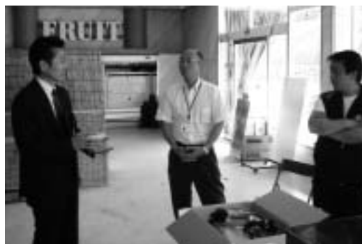
現地での専門家によるアドバイス風景