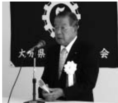
挨拶をする清家会長