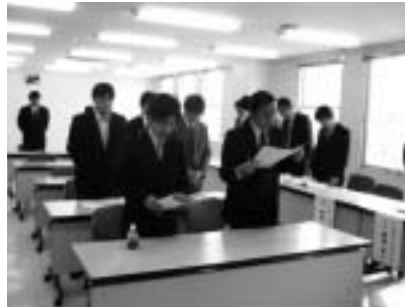
「青年部誓いの言葉」斉唱

後の組織強化対策が急務となっており、その役割を担う部長・支部長等のリーダーを対象に、「モチベーションアップの法則」と題しての講習会を実施しました。