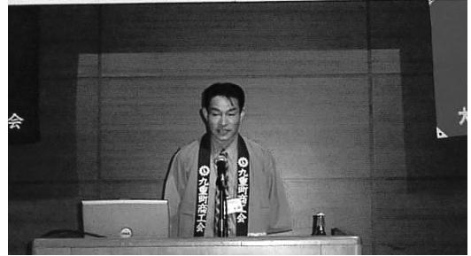
原田部長（九重町）の活動事例発表