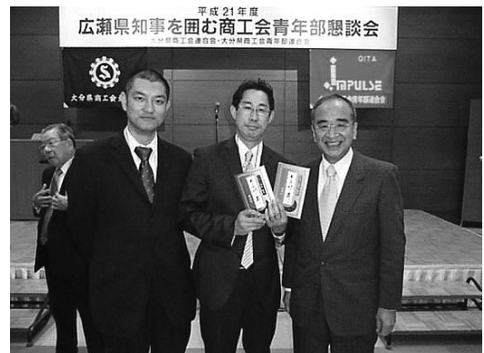
豊後大野市三重支部青年部が開発した 椎茸の漬物「般若姫の舞」をPR