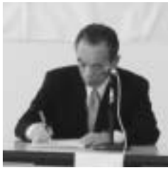
▲議長を務めた岐部会長(九重町)

商工会の会員支援機能の一層の強化を目指した商工会同士の合併を進め、平成20年度には8商工会が誕生した。