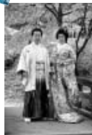
▲紅葉の美しい用作公園での撮影

A 結婚式のスナップアルバム作りを手掛けています。前撮りから披露宴までを通して、数百枚に及ぶ写真を撮影し20ページ、30ページのアルバムにまとめます。朝地にはもみじの美しい「用作(ゆうじやく)公園」や造り酒屋を改造した情緒あふれる建物があり、出張撮影も行っていきます。スタジ