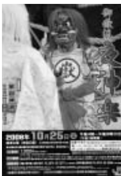
▶夜神楽のポスター

A もっともっと撮影技術を磨き、人生の大切な節目を写真で残したいというお客様のニーズに応えられるようになりたいと思います。今後は「60歳のポートレート」と題して、還暦を迎える方のアルバム作りも手がけたいと考えています。地元を本拠地として、店舗も増やしていきたいです。地域の皆様に愛されるお店をめざし頑張ります。