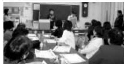
熱心に講習を受ける女性部のみなさん

2月にコンポストの講習を受講し感銘を受けた女性部員3人がその足で材料を調達し、翌日から即開始。やり方は極簡単、ダンボールに規定量のピートモス・もみ殻くん炭を入れ、毎日でる生ごみを入れてよく混ぜ合わせるだけ。これを3ヵ月間入れ続け、その後1週間に1回水分を与え、混ぜること3～4週間で分解が進み、生ごみの形が無くなったら堆肥の出来上がりです。現在、女性部各支部をはじめ、婦人会・子育てサークル等他団体を巻き込みながら、このコンポストの講習会を開催し普及・販売に励んでいます。