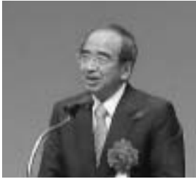
広島県知事の来賓ご挨拶