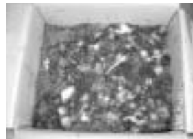
堆肥ができあがる様子