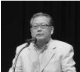
村上憲郎Google名誉会長の講演