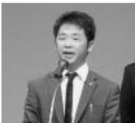
中山県青連会長の挨拶