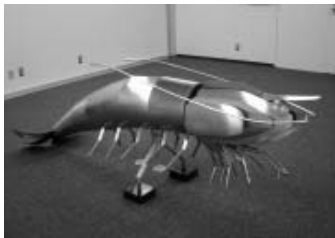
大分空港ビル到着口に展示中のオブジェ (車エビ)