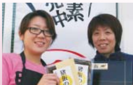
山川屋 (林石油有限会社)

お求めは直販のほか、大分新発見! わくわく館 (大分市中央町)、J R別府駅キヨスク等でも販売しています。2合炊き950円、3合炊き1,400円 (化粧箱入り1,500円)。