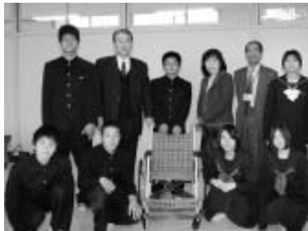
国東町商工会女性部寄贈の様子