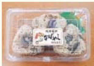
▲「なばめし」（冷凍なばめし） 「なば」は、大分方言で「椎茸」のこと。