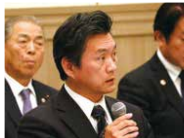
要望内容に回答する 宮成商工労働対策調査会副会長