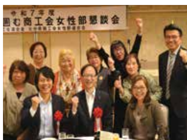
佐藤知事と記念撮影