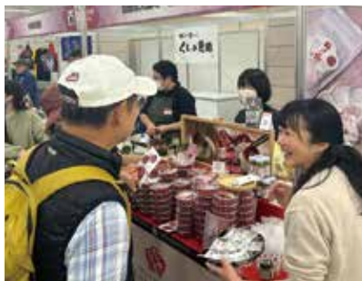
ニッポン全国物産展