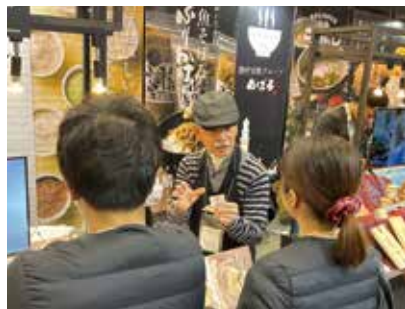
FOOD STYLE JAPAN<九州>

また、11月21日(金)~23日(日)に池袋サンシャインシティにて、ニッポン全国物産展が開催され、3日間で83,372人が来場しました。県内からは3商工会、3事業所が参加しました。