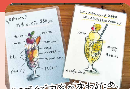
その時々で内容が変わるため、最新情報はInstagramをチェック！