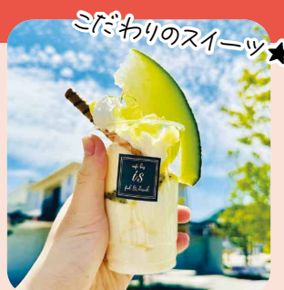
ミダわりのスイーツ★

utm_source=ig_web_button_share_sheet&igsh=ZDNlZDc0MzIxNw==