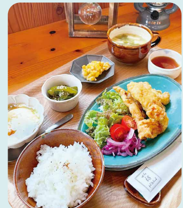
日替わりのランチメニュー