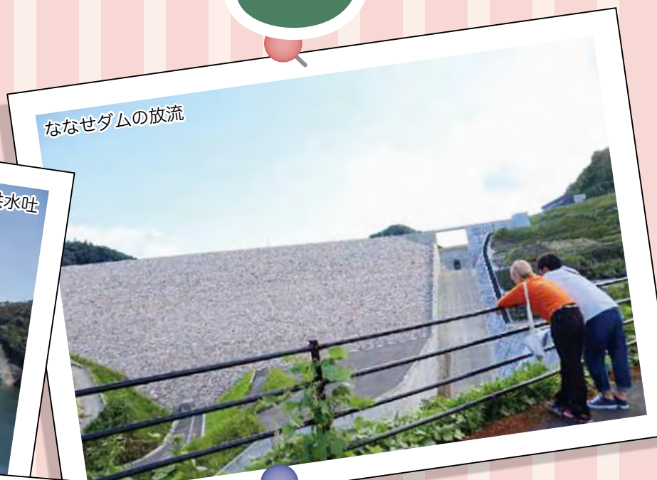
ななせダムの放流