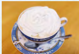
コーヒーにホイップを追加したカスタムメニュー♪ ホイップの他にもアイスやタピオカなど、3種類からお好みのドリンクにプラス100円で追加カスタムできます。今なら公式ラインを追加して下さったお客様限定で追加カスタム1回無料です。