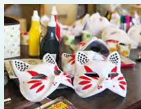
姫島の盆踊りをモチーフにしたお面の絵付け体験をいつでもお気軽に体験することができます。完成品はお土産に！

大分県東国東郡姫島村 2069 ☎0978-87-2022 / 080-6452-0263 営業時間：9:00～17:30 定休日：不定休(基本火曜日) 駐車場：なし 座席数：21席