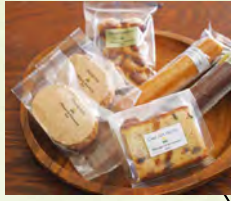
国産バター、地元産卵、ジャージー牛乳等素材を厳選して手作りしております。洋生菓子、焼き菓子ともに安心して召し上がりいただけます