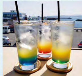
グラデーションが美しいドリンク♪ 混ぜた時の色の変化もお楽しみいただけます。

姫島港すぐ目の前に位置するオーシャンビューのお店です！姫島フェリーの発着が見えるため帰りを心配することなく、ゆったりとした時間を過ごせます。柚子エイドや果肉入りフロズン等、姫島の海に合うようなメニューを提供しています。当店は、カフェの他にも電気自動車のレンタルや観光案内、クラフト体験も出来る姫島の観光には欠かせないスポットの1つです！看板猫たちも優しい皆様のお越しを楽しみにお待ちしております♪