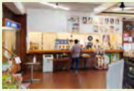
カフェでは湧水コーヒー、ソフトクリーム、夢バーガー等が人気です。売店でも地元のお土産品を多数取り揃えています