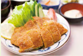
県産ハーブ鶏のモモ肉をカツにして、当店特製の甘酢タレに漬し、タルタルソースで召し上がっていただく一品です