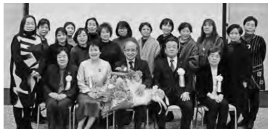
広瀬知事との記念撮影