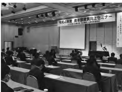
熱心にセミナーを受講する参加者