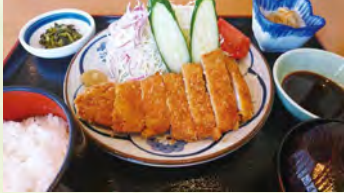
九重ブランドのポークを使用したジュシーで甘みのあるロースカツとなっております