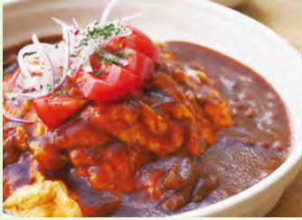
新鮮な卵をフワフワトロトロに炒め、当店オリジナルのデミグラスソースをかけた人気メニューです