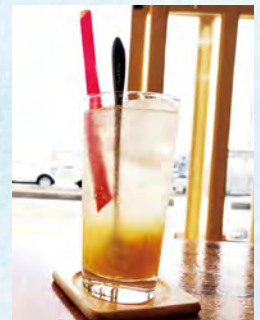
果肉がたっぷりに入った食感も楽しめるドリンク！ 寒い日はHOTの柚子ティーもお勧めです。