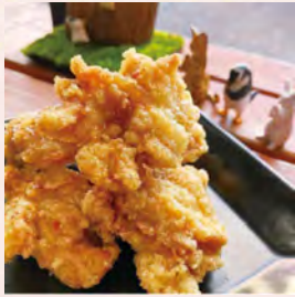
鶏モモ肉を“かま田け”秘伝のタレに一日漬けた定番の一品!