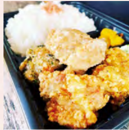
“かま田け”の人気からあげ5種類を一度に味わえる、店主イチオシのお弁当!