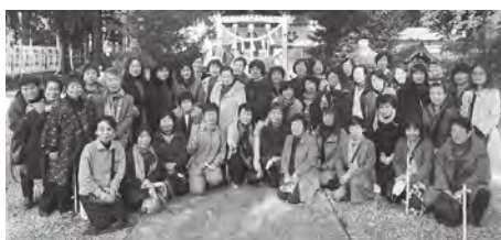
県外研修に参加した女性部員