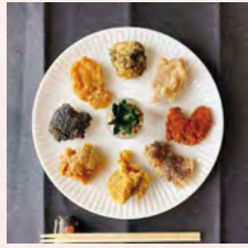
しょうゆ・塩・カレー・ゆず胡椒・のり塩・塩麹醤油(鶏ムネ)日替わり