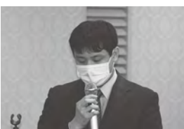
宇佐両院商工会 三ヶ田経営指導員