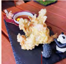
別府名物とり天を“かま田け”風にアレンジ。鶏モモ肉を和風タレに一晩漬けて、中はしっとり外はサクサクな仕上がりに!