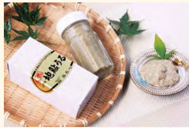
地元玖珠川産天然の鮎を使用いたしました。

名物のからあげは、おかずはもちろんお酒のおつまみにもピッタリ!温泉街の散策のおともにかがですか?玖珠川でとれた新鮮な地鮎、地元産のすっぽんも多くのお客様に喜んでいただいています。また、川漁師の店主手作りの天然鮎のうるか、滑らかな触感と深い滋味をたたえた薫り高い逸品!天瀬のグルメは鳥たつにお任せください!