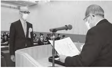
表彰を受ける高路木指導員