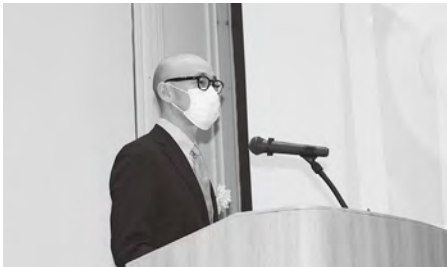
事例を発表する高路木指導員