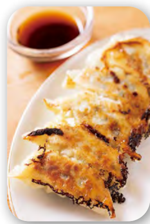
生キクラゲ入餃子