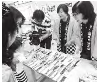
記念品配布の様子

国内唯一の生産地である「国東の七島イ」を多くの方に知ってもらうための活動として企画しており、ご利用いただいたお客様からは大変好評です。今後コロナ禍に負けぬよう女性部員一丸となり、活動を行っていきたいと思います。