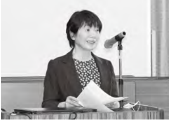
事業報告を行う発表者