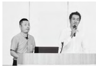
発表する豊後大野市商工会青年部