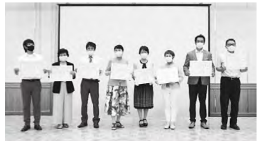
受賞団体の皆さん

世界中が新型コロナウィルスの影響を受ける中、現状の危機に対する対策に加え、10年後20年後の未来を見据えたビジョン策定の必要性について学びました。今回の研修内容を、今後の青年部・女性部活動に大いに役立てていただきたいと思います。