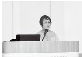
発表する宇佐両院商工会女性部