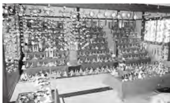
ひなめぐり会場での様子

地方創生フォローアップ事業で作成した、花雛や紙雛、ネクターネットクレス等の小物を展示しました。また、今年のメインは、「さげもん」といわれる下げ飾りです。