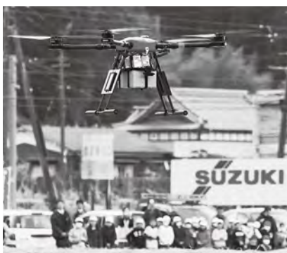
注文の商品を載せて飛び立つドローン