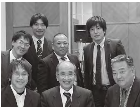
知事と懇談する参加者たち