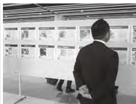
商品紹介パネル展示