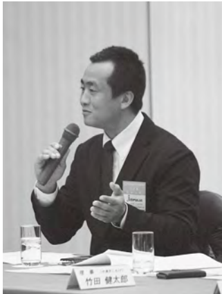
意見を述べる合谷県青連副会長

意見交換会では、お互いの連携・協力体制の構築や今後のあり方について活発な討議がなされ、今後の部員増強に向けて意識が高まる会となりました。