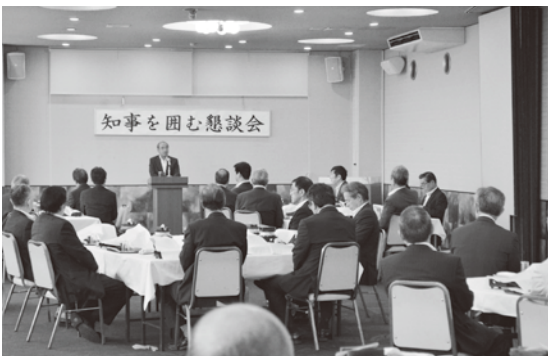
知事を囲む懇談会