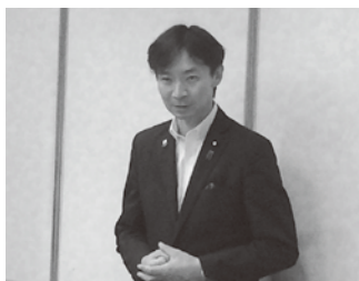
宮本全国商工会連合会顧問による講演会