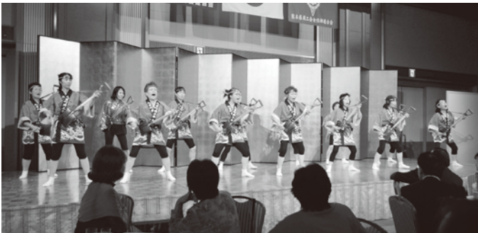
アトラクション（九重町商工会女性部）