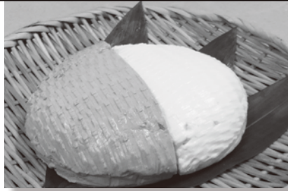
黒大豆 クロダマル 豆腐