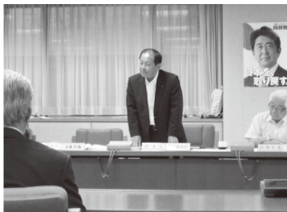
御手洗県連幹事長あいさつ