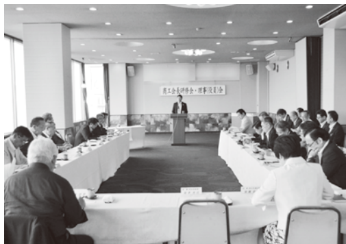
八坂氏による講演会