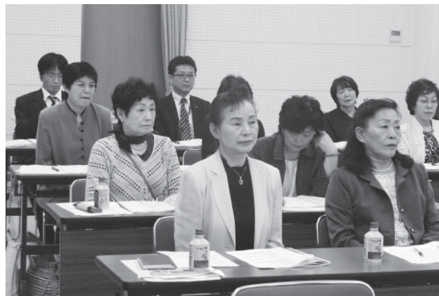
県女性連通常総会