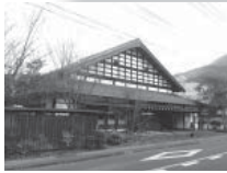
井尾百貨店 市の坐外観